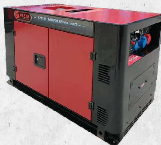
PEZAL PDE14000SA-SA3 (10 kW)