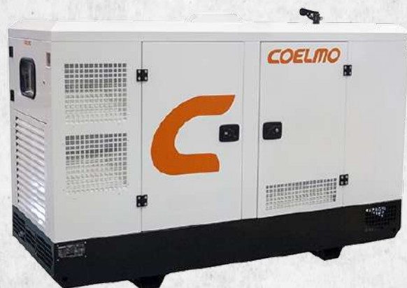
COELMO TF 88 M (64 kW)

In accordance with the plan, by May we purchased all the power generators - in total 8 units with different capacities . In June , in cooperation with our customs agency and logistics company, all the power generators were transported from Poland to Ukraine, and delivered to Kyiv, where they were warehoused by our partner NGO "Kind Hearts Brotherhood" Charitable Foundation before being dispatched to final recipients.