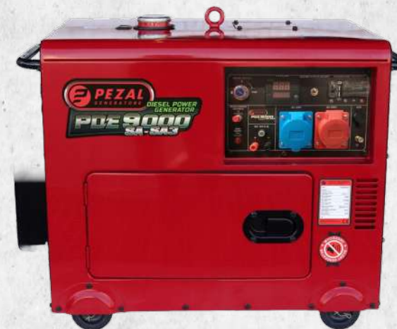
PEZAL PDE9000SA-SA3 (6,5 kW)